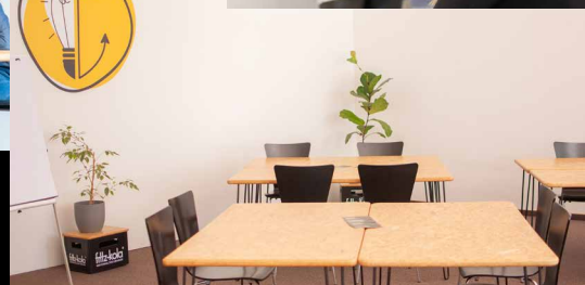
Tische & Stühle so stellen, wie ihr sie braucht